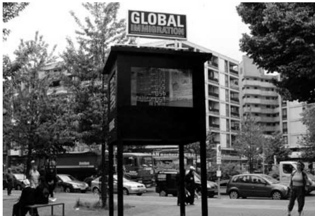
Farida Heucks Global Immigration Service Berlin . Holz, Plexiglas, Lack, Eisen / 2 x 2,2 m und 5 m hoch, Kottbusser Tor, Berlin, 2008. Unterstützt durch den Hauptstadtkulturfonds.

Gefördert vom Bundesministerium für Bildung und Forschung