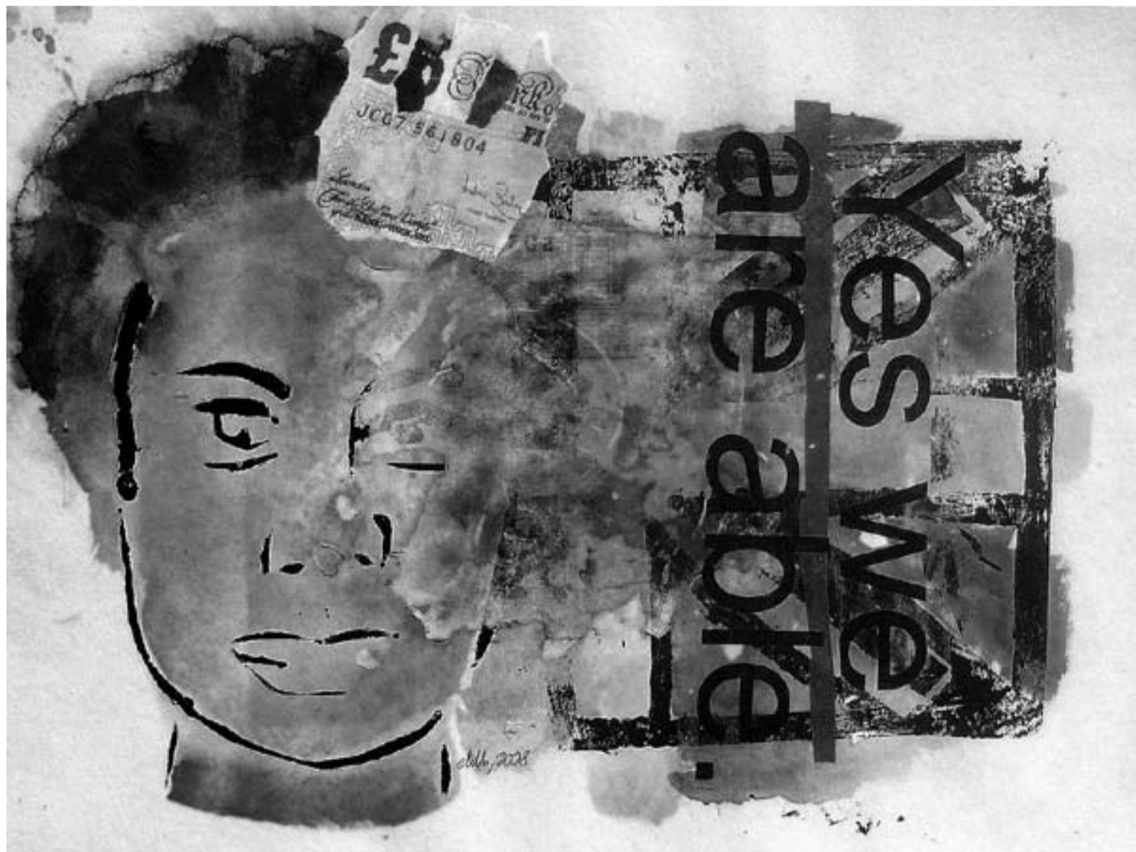
Sonia Elizabeth Barretts Obama: Black Europeans Respond . Foto: Bruno Weiss. © Sonia Elizabeth Barrett/www.sebarrett.com/YesWeCan.html

Es gibt also nicht bloß keine offen gezeigte Freude über die Vielfalt, schon gar keine Feier, wie es die UNESCO empfiehlt, sondern vielmehr Sorgen und Problemlagen. Und dies ist inzwischen so selbstverständlich im Alltag angekommen, dass man sich überhaupt nicht mehr fragt, ob die Begriffsverbindung Migration – Vielfalt – Integration so zwingend ist. Um es gleich vorweg zu sagen: Diese Verbindung ist überhaupt nicht zwingend. Man kann vielmehr zeigen, dass das Problem mit einer möglicherweise misslingenden Integration so alt ist wie die kapitalistisch organisierte Industriegesellschaft und überhaupt nichts mit Italienern und Griechen, mit Spaniern, Portugiesen und Türken zu tun hat, die man seinerzeit als Arbeitskräfte dringend gebraucht hat und die heute einigen Menschen in Deutschland Unbehagen verursachen. Wenn dies aber so ist, dann läuft offenbar Einiges in der politischen Diskussion schief. Dann tritt auch die Relevanz der Frage zurück, ob das Problem mit „Interkultur“ oder mit „Transkultur“ richtig erfasst wird – ein Nebenkriegsschauplatz, der geistige Energien bindet, die man an anderer