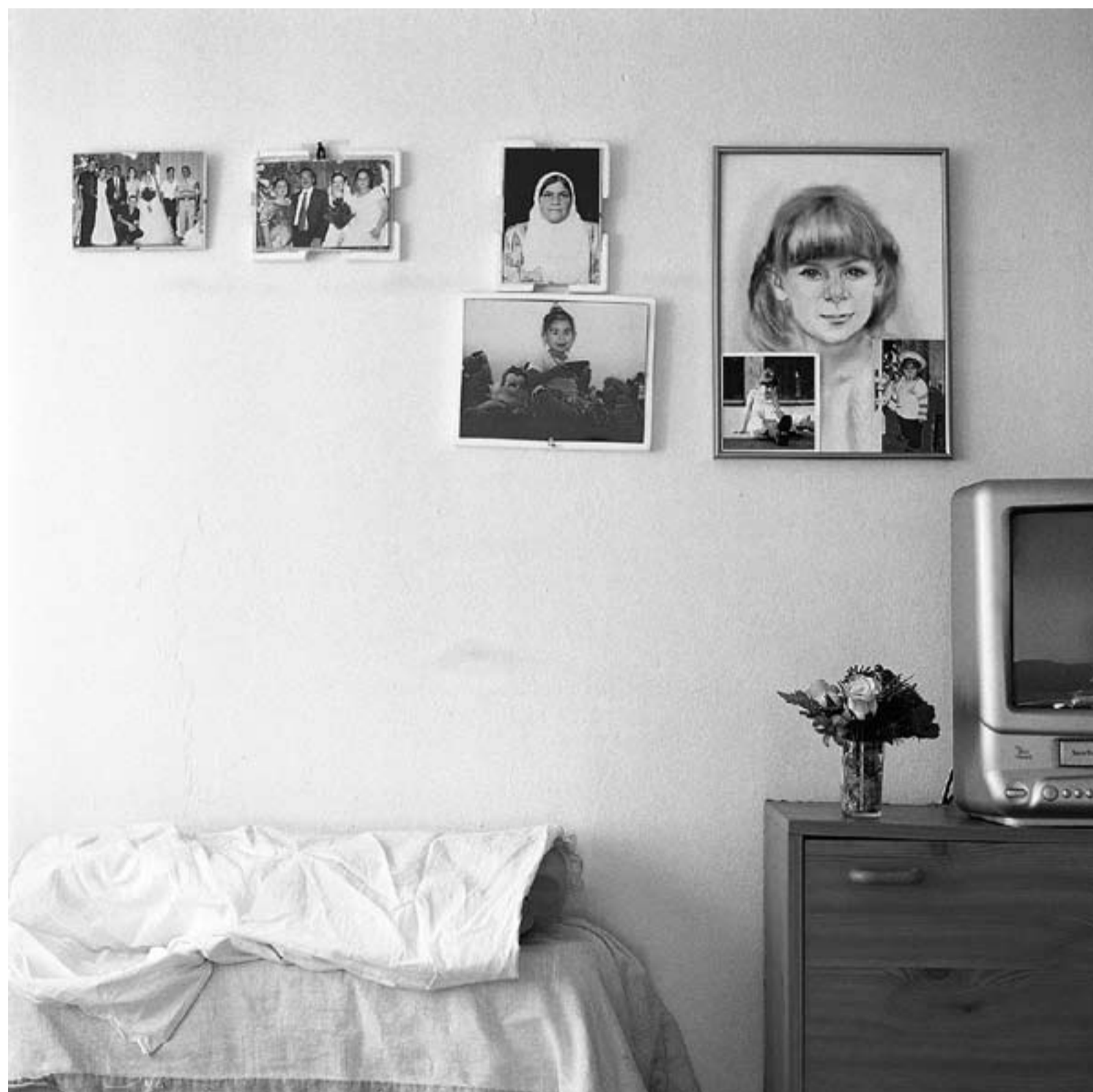
Christina Kratzenbergs Fotografie Schöngartenstraße – Asylsuchende in Deutschland .

Internationalität findet heute bereits vor der eigenen Haustüre an. Dies wirft Fragen – auch für die Popkultur – auf: Wer bin ich selbst? Wofür ent-